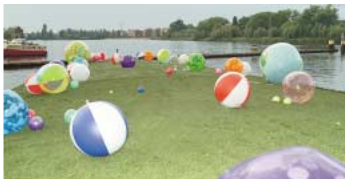
Kunst auf dem Schiff